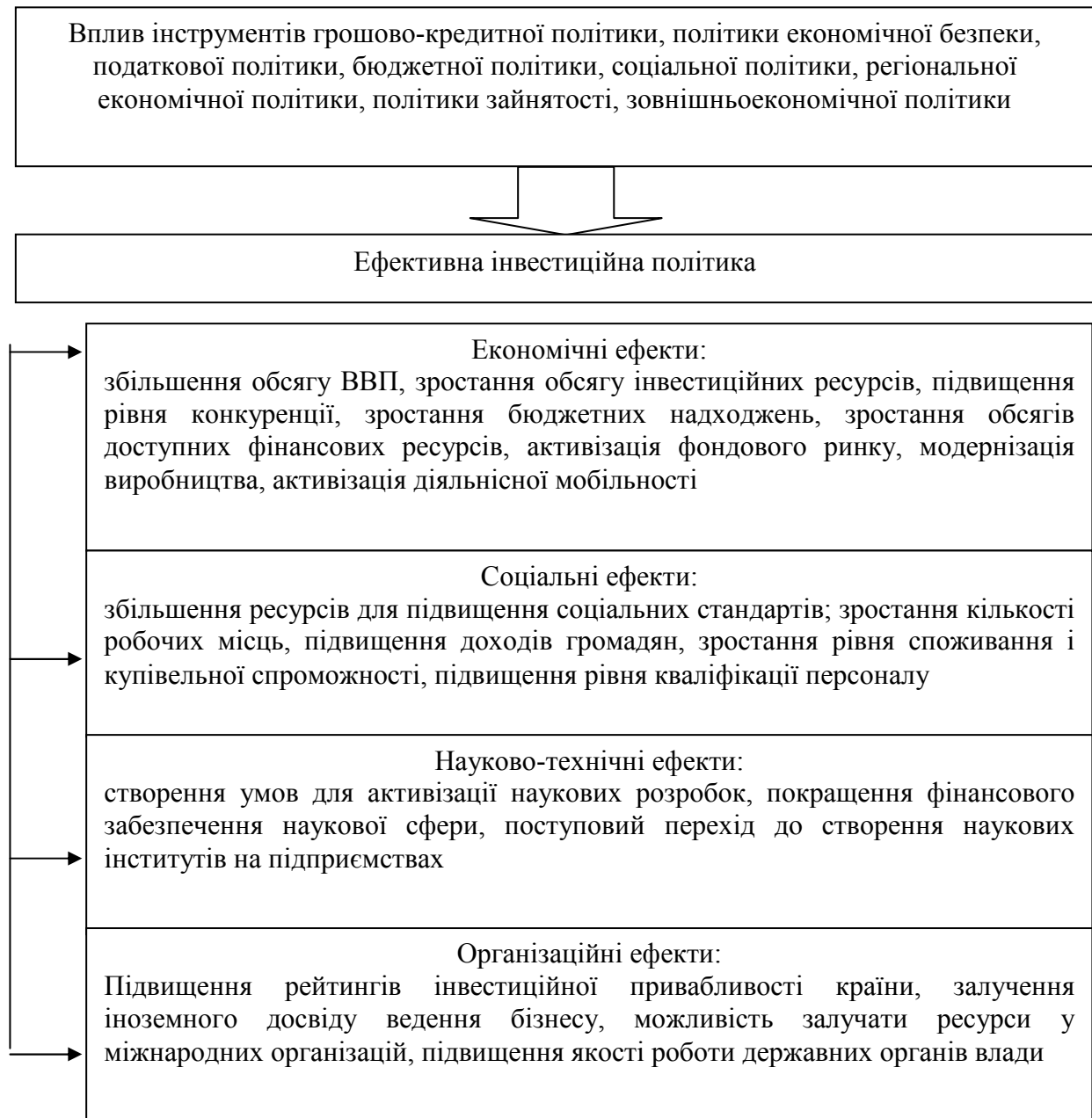
Рис. 2. Ефекти від реалізації інвестиційної політики

Саме суттєвий дефіцит внутрішніх інвестиційних ресурсів актуалізує залучення прямих іноземних інвестицій (ПІІ). Задовільним для інвестиційно-інноваційної безпеки України вважається рівень залучення ПІІ, за якого відношення чистого річного приросту ПІІ до ВВП знаходиться на рівні 6%. Натомість, в Україні цей показник є критично низьким - нижче 2%, що свідчить про вкрай недостатні обсяги залучення ПІІ в економіку [35].